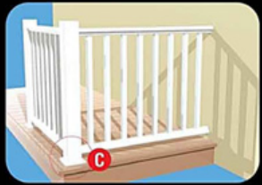
3. ประกอบราระเบียงไว้นิล (บน-ล่าง) เข้ากับลูกระเบียงไว้นิลให้เรียบร้อย แล้วนำมาติดตั้งกับเสาไว้นิลและชุดข้อต่อผนัง