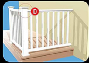
4. ครอบหัวเสาไว้นิลในแต่ละจุดจนครบให้เรียบร้อย